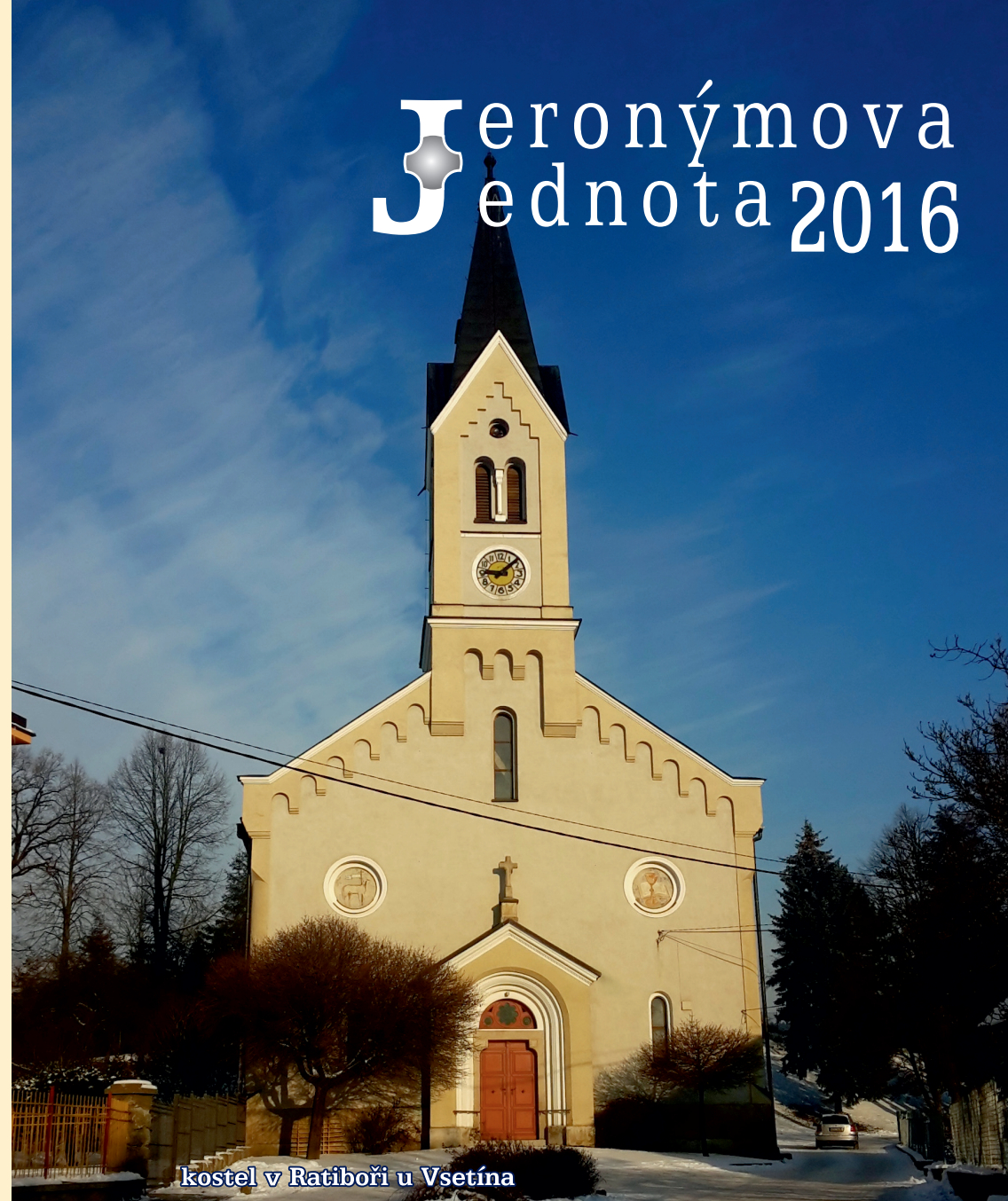
Kostel v Ratiboři u Vsetína